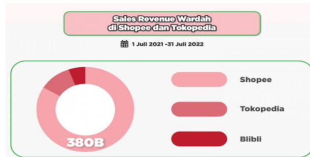
Gambar 1. Data Sales Revenue Wardah di Shopee dan Tokopedia

penjualan Wardah selama satu tahun terakhir, terhitung sejak 1 Juli 2021- 31 Juli 2022 di Shopee dan Tokopedia untuk Official dan Non-Official Store.