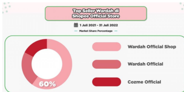
Gambar 2. Data Top Seller Costumer Wardah pada Platform Shopee

Terlihat dari data tersebut bahwa penjualan Wardah pada platform Shopee memiliki penjualan tertinggi sebesar Rp 380 miliar, diikuti dengan platform Tokopedia sebesar Rp 50 miliar dan penjualan ketiga pada platform Blibli yaitu sebesar Rp 25 miliar.