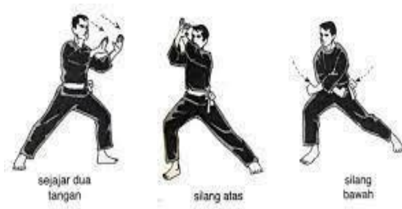
Gambar. Tangkisan (Teknik bela pencak silat)