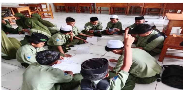
Gambar 1. Guru memberikan teks Arab untuk dibahas

Pernyataan dari Zahwa menunjukkan pengalaman pribadi dalam penerapan teknik meringkas yang efektif. Ia mengungkapkan bahwa meskipun awalnya kesulitan memahami teks Arab, penggunaan teknik interaktif membantunya untuk mengidentifikasi poin-poin penting dalam teks. Hal ini tidak hanya meningkatkan pemahaman teks, tetapi juga mengembangkan kemampuan berpikir kritis dan kepercayaan dirinya dalam merangkum informasi. Data diatas diperkuat oleh observasi dan dokumentasi dibawah ini: