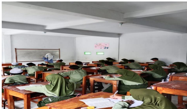
Gambar 2. Teknik Meringkas Setelah Membaca Teks Bahasa Arab Melalui Mind Mapping

Penjelasan Ustadz Huda diatas bahwa mind mapping tidak hanya mempermudah siswa dalam memahami struktur teks, tetapi juga mengembangkan keterampilan berpikir kritis mereka. Dengan memetakan ide-ide dalam bentuk visual, siswa dapat lebih mudah menganalisis hubungan antar gagasan. Diskusi kelompok yang dilakukan setelah teknik ini juga memberi kesempatan kepada siswa untuk saling berbagi pemikiran dan meningkatkan pemahaman mereka secara kolektif, memperkaya perspektif masing-masing. Data diatas diperkuat dengan hasil data observasi dan dokumentasi berikut: