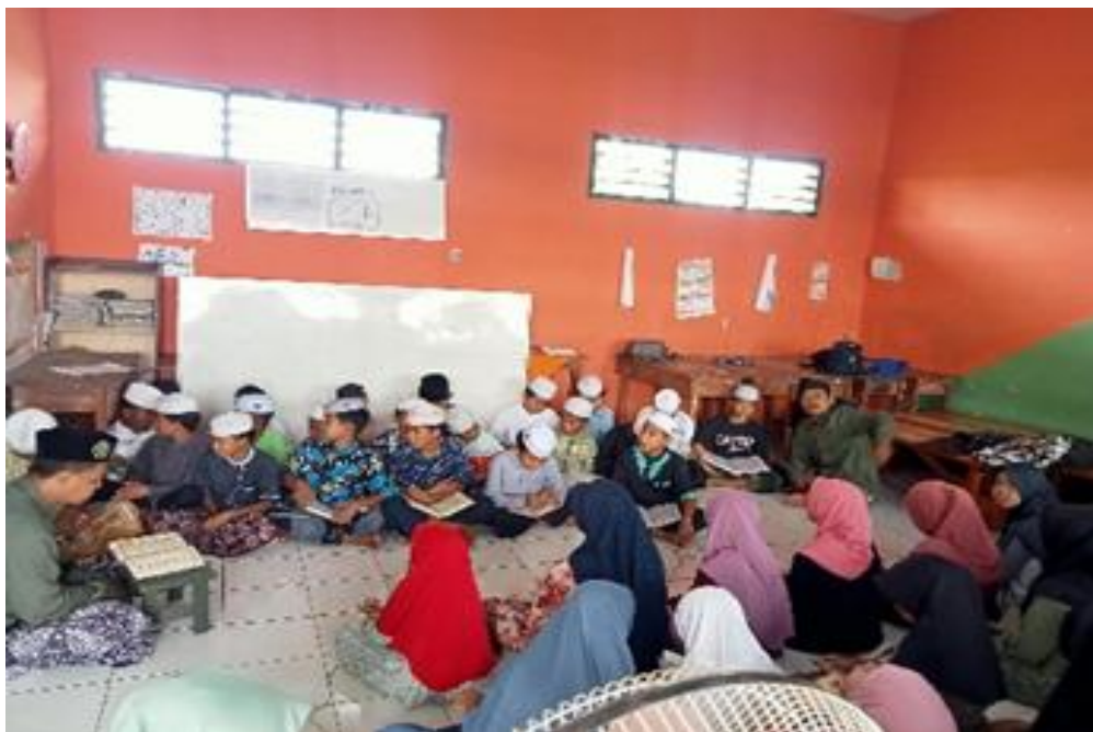
Gambar 3. Kajian bentuk kata kerja, kata benda dan perubahan makna

keagamaan dan memiliki rasa percaya diri dalam menggunakannya secara aktif. Selain itu, integrasi ini juga memperkuat identitas keislaman siswa karena mereka merasa lebih dekat dengan bahasa Al-Qur'an. Data diatas diperkuat dari hasil observasi dan dokumentasi dibawah ini: