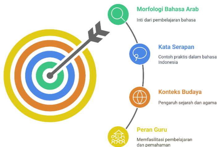
Integrasi Morfologi Bahasa Arab dalam Pendidikan

Tabel diatas menjelaskan contoh Morfologi Arab yang diserap dalam bahasa Indonesia menunjukkan betapa erat hubungan kedua bahasa ini, terutama karena faktor agama Islam, sejarah, dan kebudayaan. Pemahaman tentang adaptasi ini penting untuk memperkaya pengetahuan kebahasaan siswa dan memperkuat keterampilan berbahasa mereka baik dalam bahasa Arab maupun Indonesia.