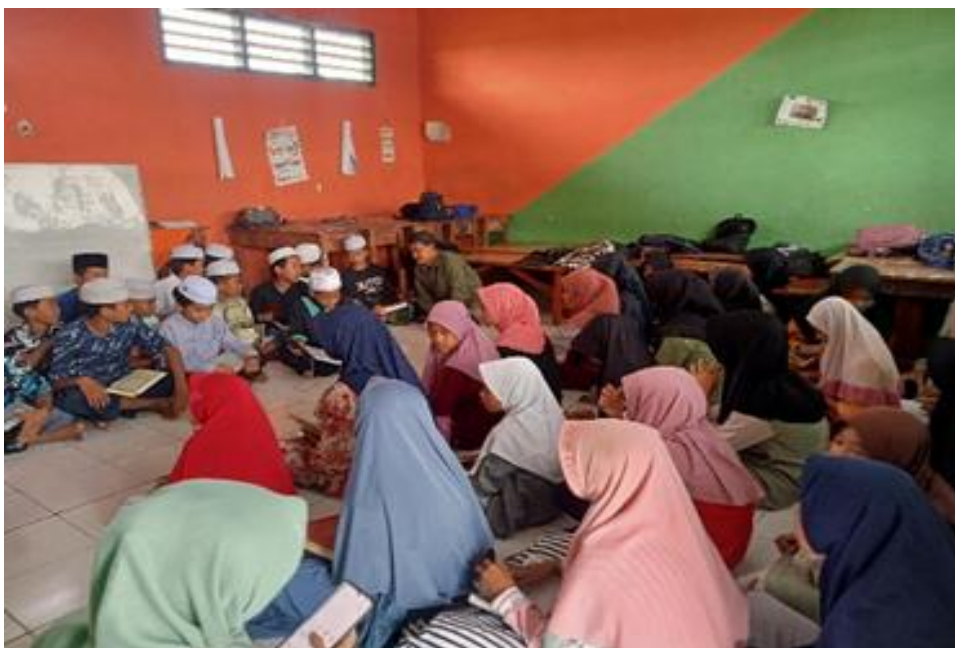
Gambar 1. Pembelajaran perubahan bentuk kata dalam bahasa arab

Pernyataan ini menegaskan bahwa penggunaan morfologi bahasa Arab tidak hanya bersifat pasif, tetapi telah aktif diaplikasikan oleh siswa dalam komunikasi lisan maupun tulisan. Proses ini mencerminkan pembelajaran yang kontekstual dan berkelanjutan dalam lingkungan madrasah. Data diatas diperkuat dari hasil observasi dan dokumentasi dibawah ini: