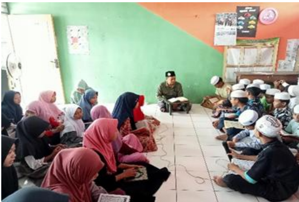
Gambar 2. Suasana Pembelajaran Morfologi

Kutipan Ibu Soraya dan Yasa menunjukkan bahwa siswa mulai memahami hubungan antara bahasa Arab dan bahasa Indonesia, meskipun pemahaman mereka masih terbatas pada konteks dan hafalan, belum pada analisis morfologis secara mendalam. Data diatas diperkuat dari hasil observasi dan dokumentasi dibawah ini: